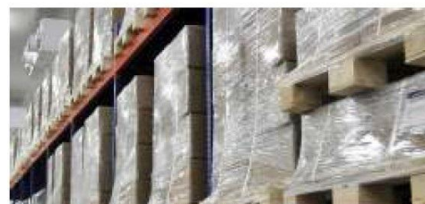
Increased movement of pharmaceutical, dairy, poultry and meat products has raised the demand for cold chain services.

For instance, Container Corporation of India (Concor), the only company that moves meat products between Dadri in National Capital Region and Mumbai for ex-